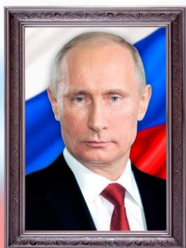
ПУТИН ВЛАДИМИР ВЛАДИМИРОВИЧ

Согласно Конституции главой государства Российской Федерации является Президент. В статье 80 Конституции РФ сказано, что Президент РФ является гарантом Конституции РФ, прав и свобод человека и гражданина. В установленном Конституцией РФ порядке он принимает меры по охране суверенитета РФ, ее независимости и государственной целостности, обеспечивает согласованное функционирование и взаимодействие органов государственной власти, определяет основные направления внутренней и внешней политики государства.