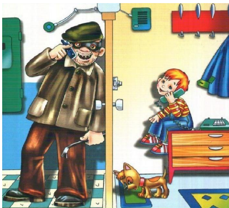
Разговор с незнакомыми людьми по телефону