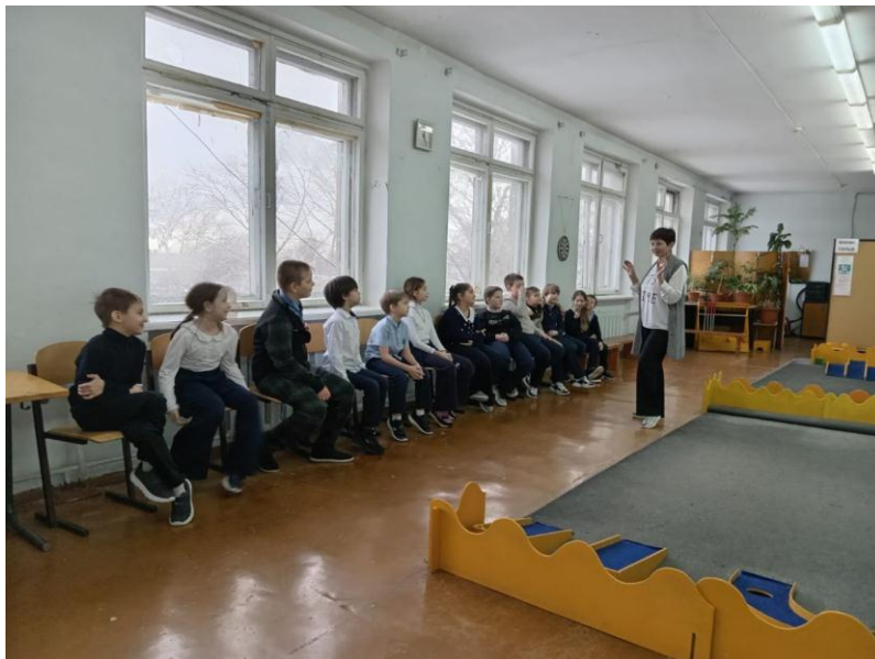
Беседа по правилам общей безопасности