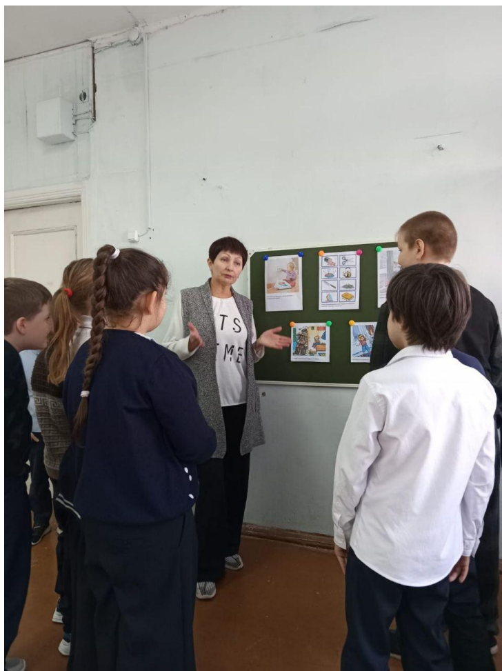
Вопросы и ответы обучающихся