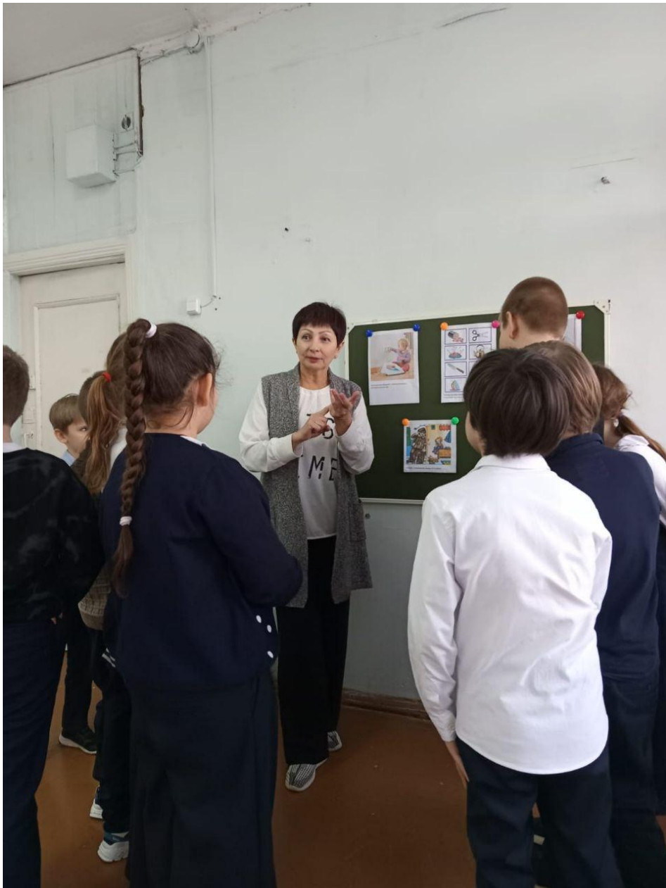
Подведение итогов мероприятия