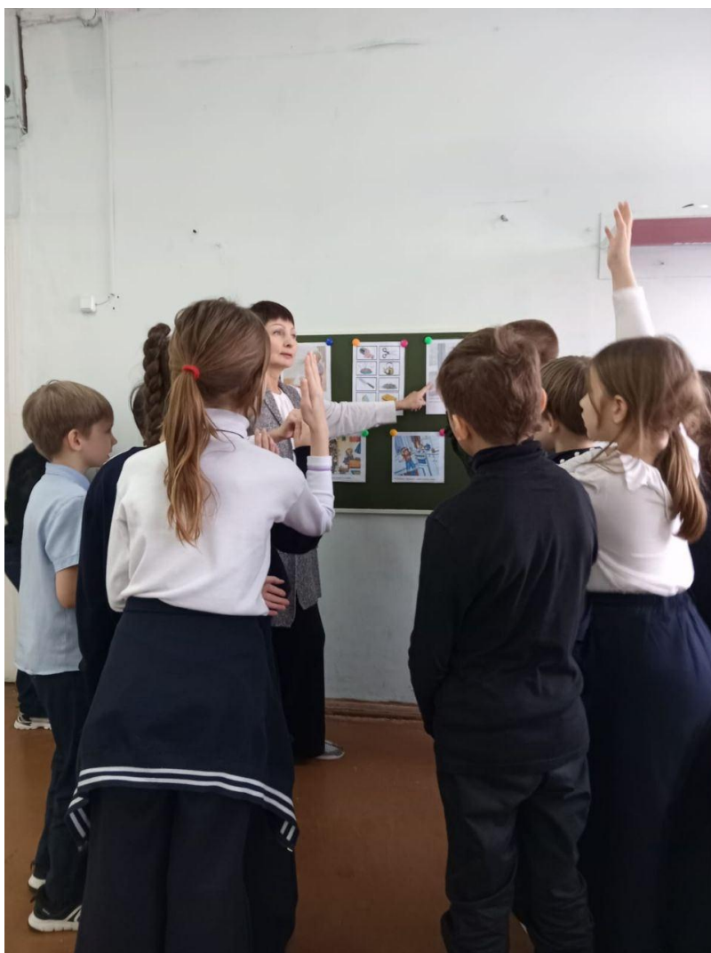
Блиц-игра по карточкам безопасности