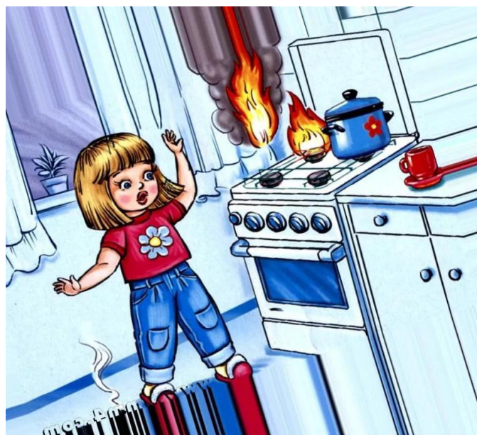
Не осторожное обращение с газовой плитой и с огнем