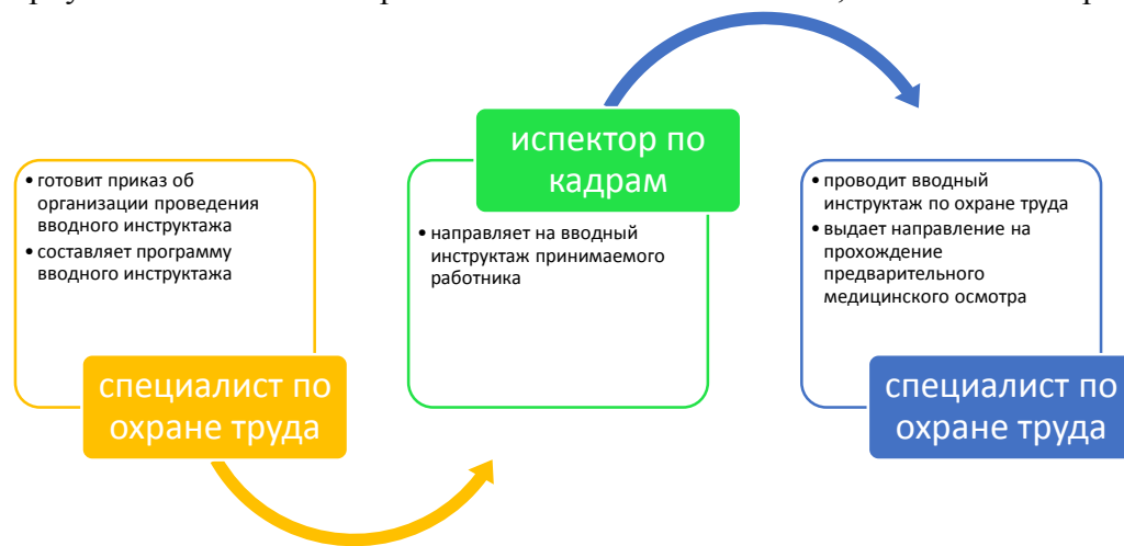
Рис. 12.4.4. Схема проведения вводного инструктажа

12.4.4. Кроме вводного инструктажа по охране труда на рабочем месте, повторный, внеочередной и целевой инструктаж проводится по мере необходимости.