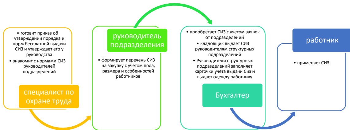
Рис. Процедура обеспечения работников средствами

12.16.1. С целью организации процедуры выдачи СИЗ, являющимися и обезвреживающими средствами, своей деятельности устанавливает (определяет) порядок выявления потребности в СИЗ, являющимися и обезвреживающими средствами;