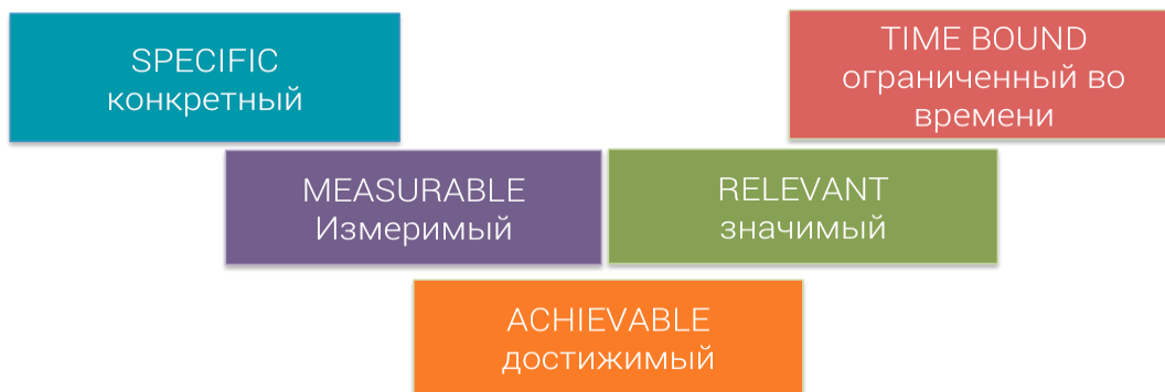
Таблица задачи системы управления

10.2. Задачи СУОТ в соответствии с Техническим заданием отражены в таблице