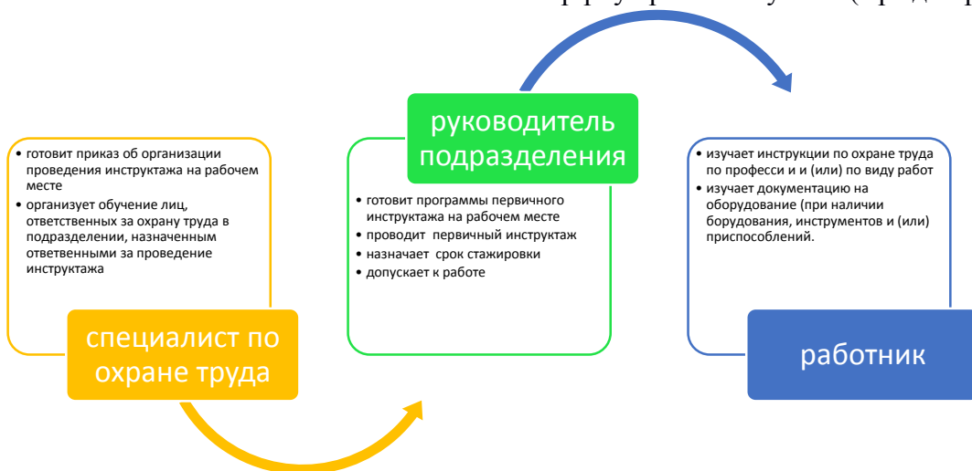
Рис. 12.4.5. Схема проведения инструктажа на рабочем месте

Первичный инструктаж по охране труда проводится с работниками, освобожденными от работы на период обучения в учебном заведении, с работниками, переводимыми на другую работу, с работниками, поступающими на работу в организацию, с работниками, поступающими на работу в организацию, с работниками, поступающими на работу в организацию. Первичный инструктаж по охране труда проводится с работниками, освобожденными от работы на период обучения в учебном заведении, с работниками, переводимыми на другую работу, с работниками, поступающими на работу в организацию, с работниками, поступающими на работу в организацию, с работниками, поступающими на работу в организацию.